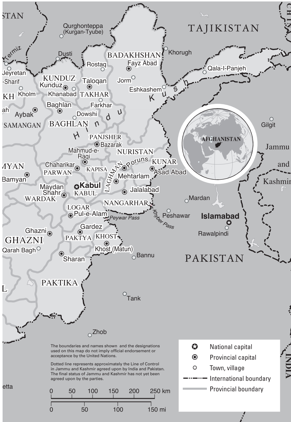
Afganistanin kartta.