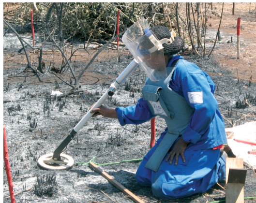
Maanraivausta Mosambikissa maaliskuussa 2008. Suomi on rahoittanut maassa maamiinojen vaaroista kertovaa ennaltaehkäisykampanjaa ja koulutusta.

Eettisen sijoittamisen raportissa kerrottiin myös Kevan omistavan STE:n osakkeita 17,1 miljoonan euron arvosta. Kevalla on suoriam osakesijoituksiam 4,8 miljardin euron arvosta ja kaikkien sen sijoitusten arvo noin 29,4 miljardia euroa.